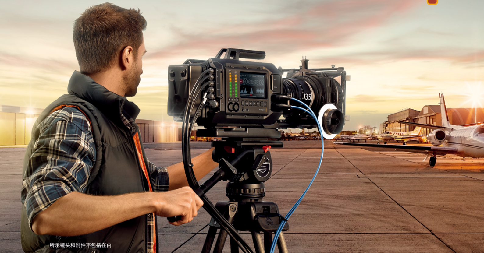
所示镜头和附件不包括在内