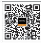
索尼影视专业制作乐园