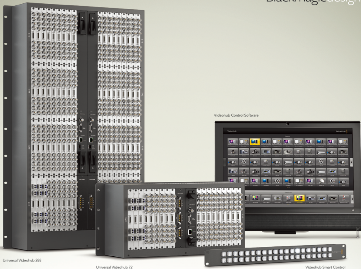
Universal Videohub 288