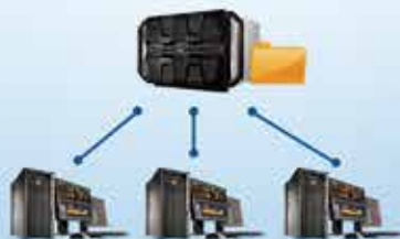
XPRI 组共享存储 NS-TEAM/ST