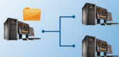
XPRI 工作组 NS-TEAM