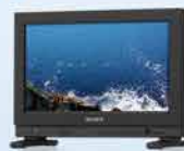
LMD-A170 (分辨率: 1920x1080)