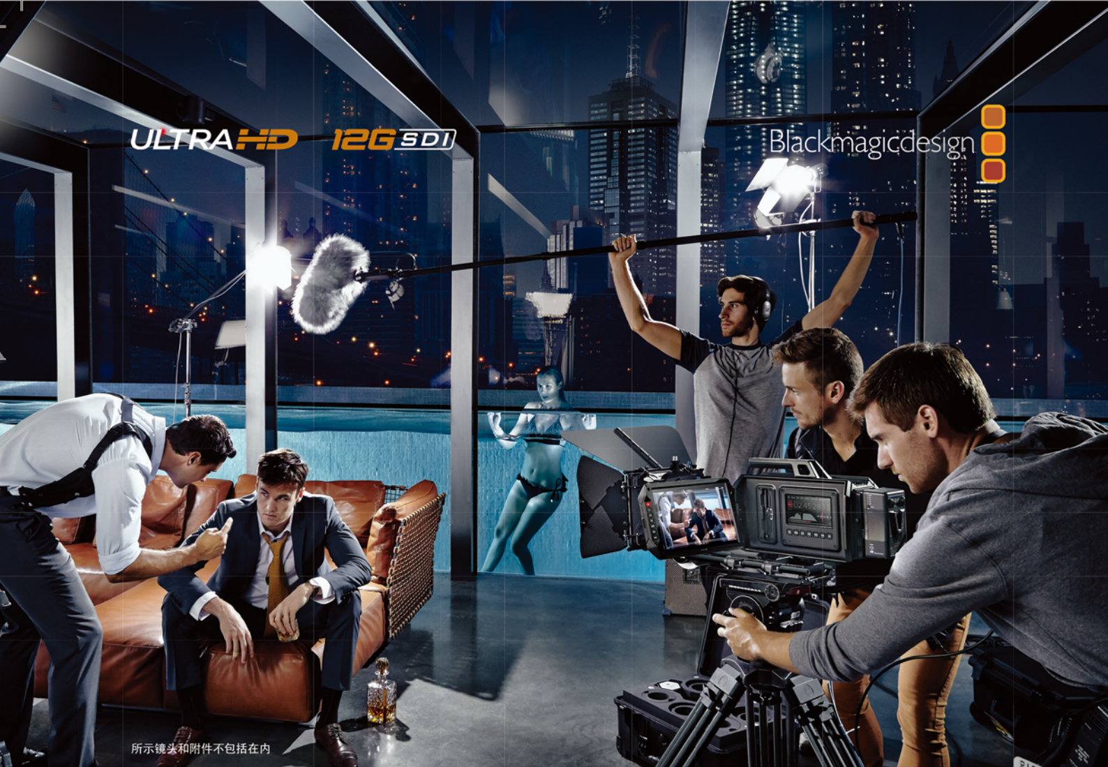
所示镜头和附件不包括在内