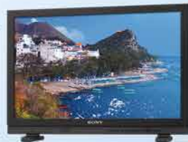
LMD-A240 (分辨率: 1920x1200)