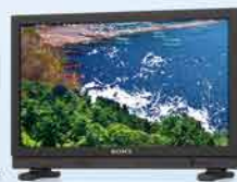
LMD-A220 (分辨率: 1920x1080)