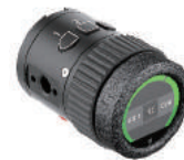
OCU-1 掌镜控制器 无缝切换焦点控制 用户自定义按键