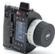
WCU-4 经典无线控制手柄