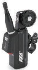
Cforce mini RF 无线马达 14通道 最新的无线模块